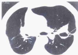
图 4 例 4 术后胸部 CT 扫描显示有空洞(箭头示处)