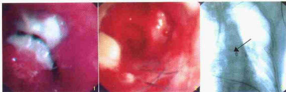
图 1 例 3 术后 1 个月纤维支气管镜检查示支气管吻合口局部侧壁软化、狭窄为坏死组织覆盖 图 2 置入钛网支架后纤维支气管镜所见 图 3 X 线胸片箭头指处为置入支架